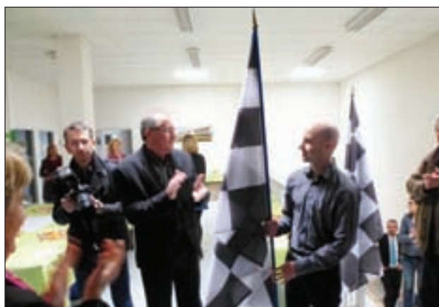
passage de relais BGE - MFQ

a fait le lien entre la « responsabilité sociétale et l'innovation sociale »